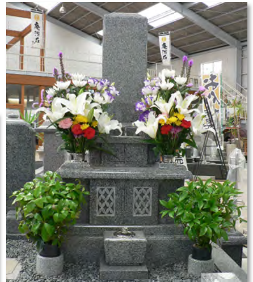
和型はより立派に