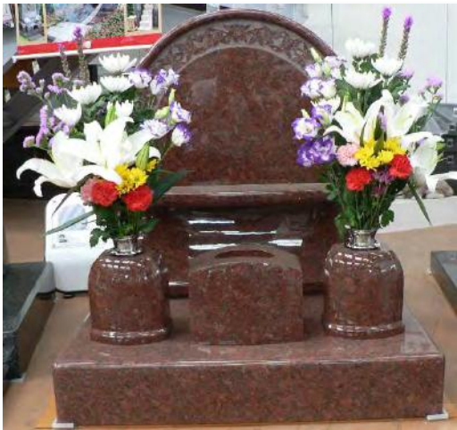
洋型はより優雅に