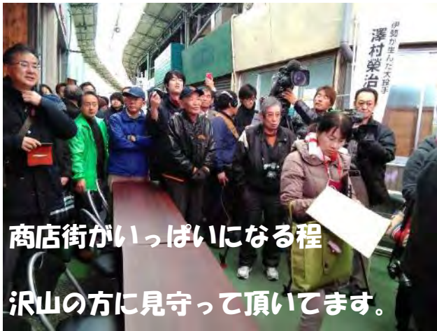
商店街がいっぱいになる程 沢山の方に見守って頂いてます。