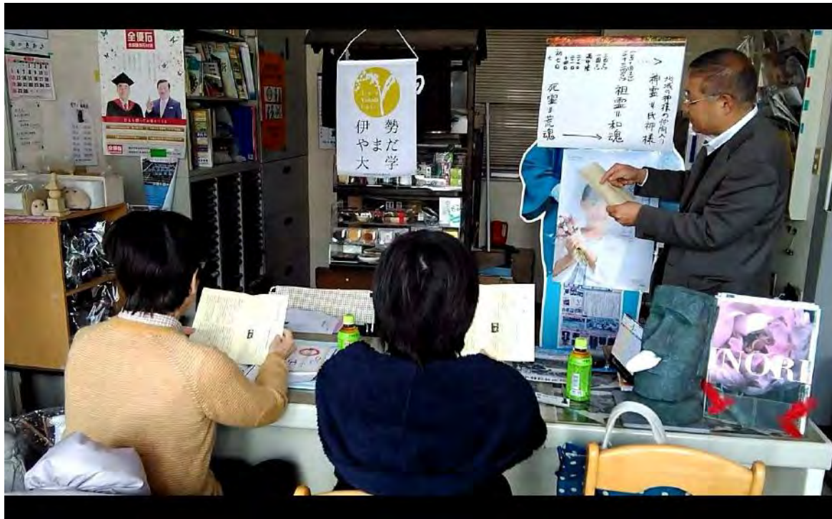
初日(2017年2月14日)の様子です。一之木店にて行いました。 2名の方にご参加いただき、とても熱心に聞いて頂きました。

日本人ならだれでも納得できるお墓の話。2千年前の昔から日本人がお墓に込めてきた「大切な心」の原点についてお話ししました。