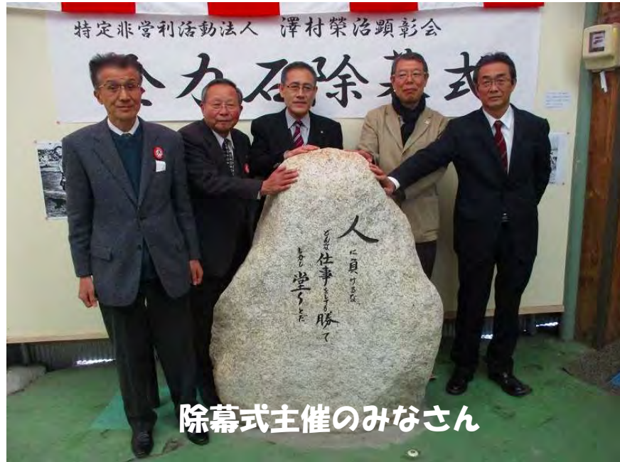
除幕式主催のみなさん